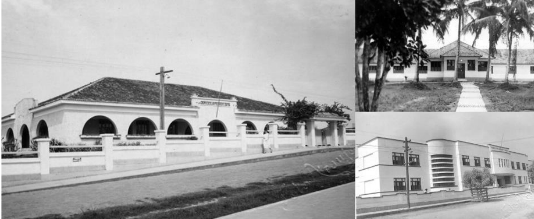
Fotos da capital Rio Branco.

21. Os índios Apurinãs foram os primeiros habitantes do estado. A partir de 1877, imigrantes nordestinos lá chegaram para trabalhar na extração do látex. O território do Acre pertencia à Bolívia e ao Peru, sendo aos poucos ocupado por brasileiros. Para garantir o domínio da área, os bolivianos começaram a cobrar impostos sobre a extração da borracha e fundaram a cidade de Puerto Alonso. Após conflitos armados a cidade foi tomada por brasileiros e rebatizada como Porto Acre. O fim dos conflitos entre bolivianos e brasileiros se deu com a assinatura do Tratado de Petrópolis em 17 de novembro de 1903, no qual o Brasil adquiriu o território do Acre. Problemas nos limites com Peru também aconteceram. Os peruanos foram expulsos das áreas ocupadas em setembro de 1903. O impasse só se resolveria por completo em 8 de setembro de 1909. A administração do Acre seria exercida por um governador nomeado pelo Presidente da República até 1962. Neste ano, em 15 de junho, o então presidente João Goulart eleva o território a categoria de estado pela Lei 4.070. O Acre é um dos estados da região Norte. (Adaptado. Fonte: https://cidades.ibge.gov.br/brasil/ac/historico – acesso em 19 de junho de 2019.)